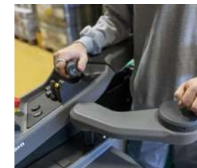
Volant et accoudoirs réglables