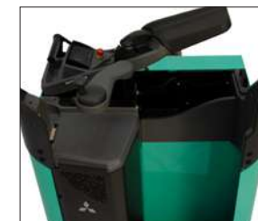
Compartment de rangement sous l'accoudoir